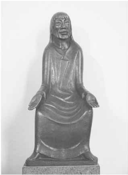
Ernst Barlach, Der lehrende Christus , Antoniterkirche Köln

Jesus ist nicht nur ein Freund. Er ist auch Lehrer der Wahrheit und des Lebens. Er zeigt uns den Weg, wie wir glücklich werden können.