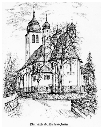
Pfarrkirche St. Matthias-Fretter

Ihr sollt aber erkennen, dass der Menschensohn die Vollmacht hat, hier auf der Erde Sünden zu vergeben. Und er sagte zu dem Gelähmten: Ich sage dir: Steh auf, nimm deine Tragbahre, und geh nach Hause! Der Mann stand sofort auf, nahm seine Tragbahre und ging vor aller Augen weg. Da gerieten alle außer sich; sie priesen Gott und sagten: So etwas haben wir noch nie gesehen. Markus 2, 1-12